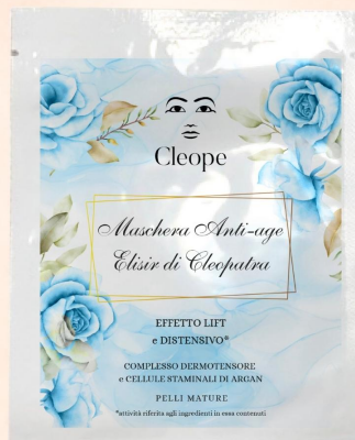
MASCHERA ANTI -AGE

Patch occhi effetto Lift e distensivo con fiori di Verbasco e Camomilla biologica.